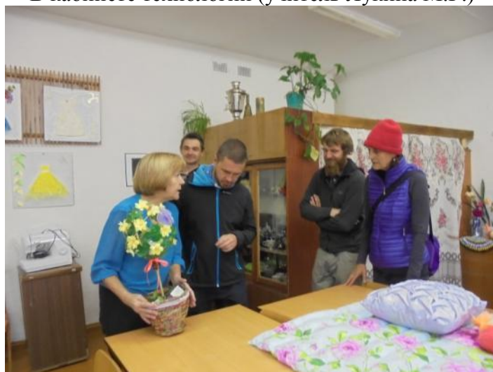
Гости заинтересовались работами учащихся