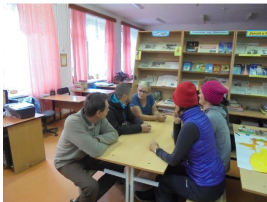
В школьной библиотеке