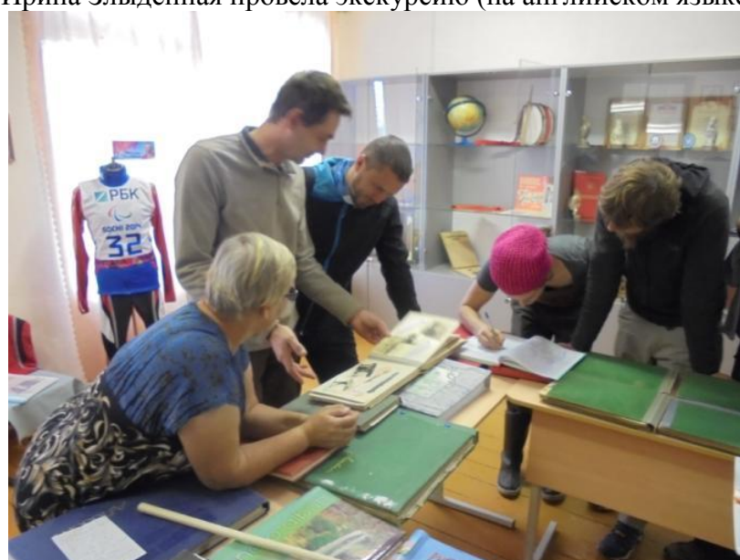
Пишут отзыв о посещении музея