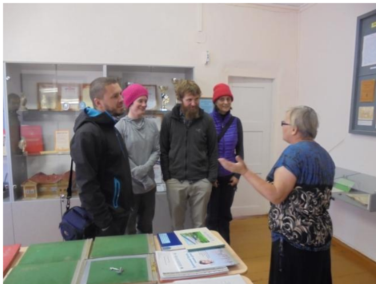
В школьном Музее Народного образования